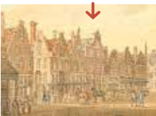
Grote Markt, ca. 1765. Bij de pijl nr. 10.

Het hart van de stad. Op 1 oktober 1549 werd Filips II hier als landsheer ingezworen. Ook de Haarlemse burgers, onder wie hoogstwaarschijnlijk de 27-jarige Coornhert, legden toen een eed van trouw aan hun vorst af.