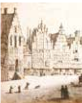
Links de Hoofdwacht, 1629

De Beek was een met platte, smalle schuiten bevaarbare waterloop, die vanuit het duingebied onder de namen Brouwersvaart en Raaks de stad binnenkwam om als Beek bij het Slepershooft in het Spaarne uit te monden. De Beek werd in 1867 gedempt.